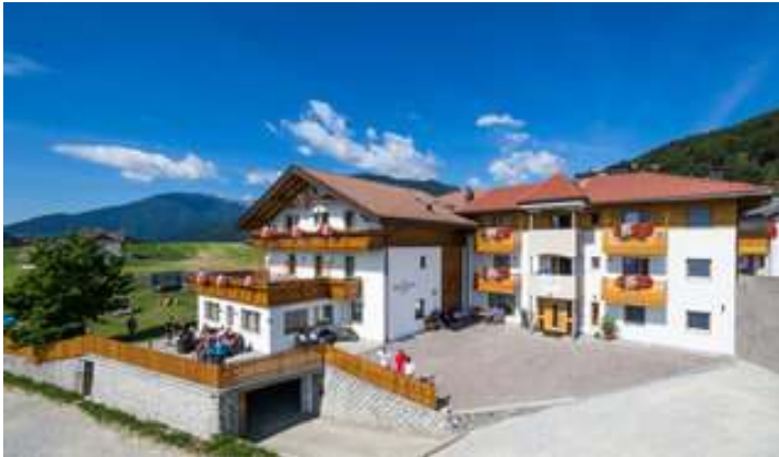
Rodinný penzión Brunnerhof