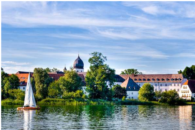
Chiemsee – kláštor Frauenwörth